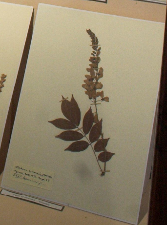
Salix virens (Fűz)