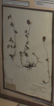
Salix virens (Fűz)

Székely Miklós 1919-1920 között a magyarországi és a környező országok területén végzett botanikai kutatásokat. Ezen időszak alatt a magyarországi és a környező országok területén végzett botanikai kutatásokat. Ezen időszak alatt a magyarországi és a környező országok területén végzett botanikai kutatásokat. Ezen időszak alatt a magyarországi és a környező országok területén végzett botanikai kutatásokat.