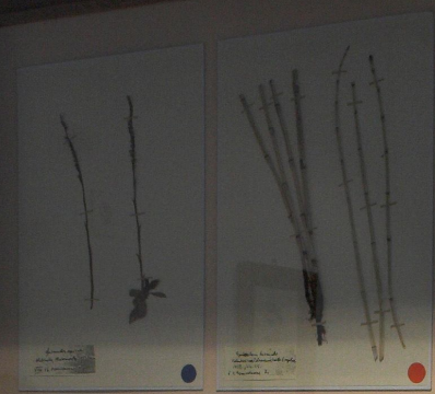
Salix glabra (Körte)