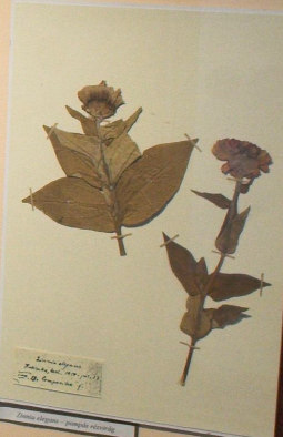
Salix virens (Fűz)